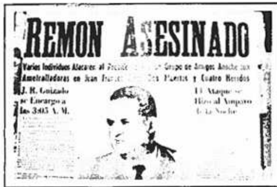
Presidente JOSE ANTONIO REMON