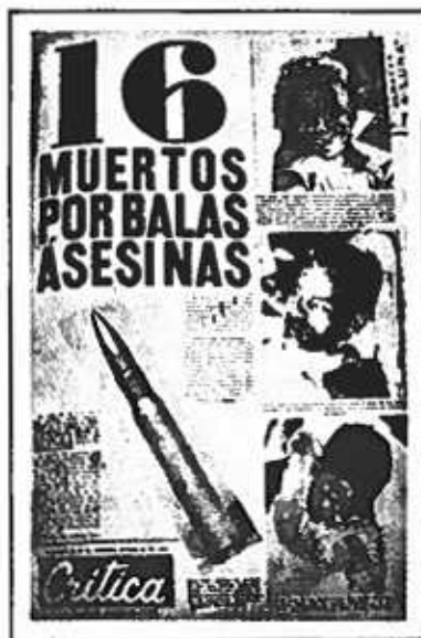
Agresión de el ejército de los Estados Unidos con el pueblo panameño.

un papel importante destacándose al cual tuvo que persuadir para evitarse los Estados Unidos (Ejército).