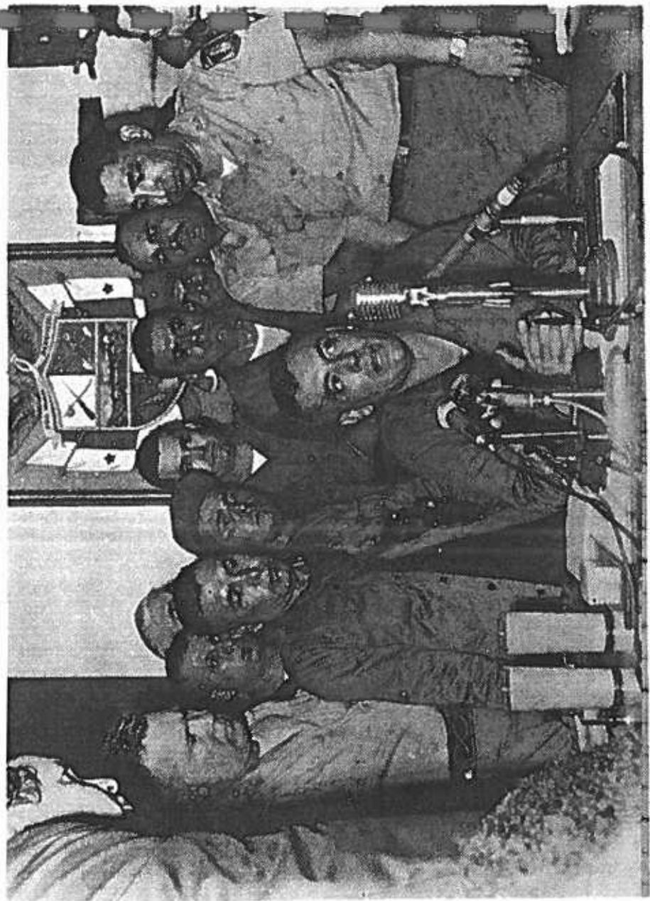
Conferencia de prensa que da el General Torrijos, informando a la ciudadanía su esquema de gobierno

esta de barro, tadas gua no hayan a una gra botellas de