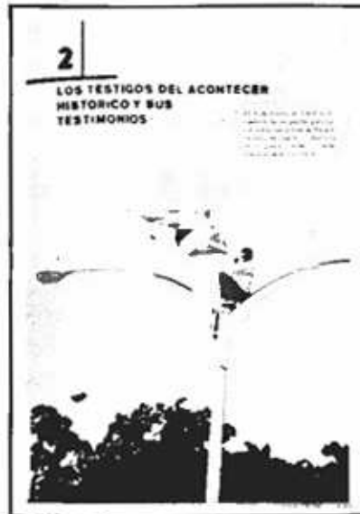
Panameño izando la Bandera Nacional en el área de la Zona del Canal.